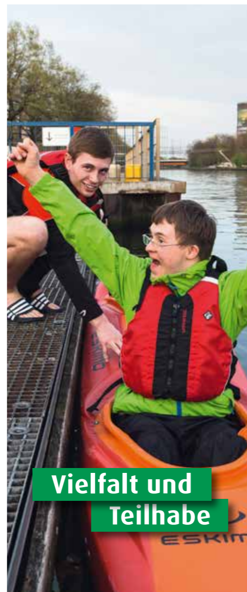
Vielfalt und Teilhabe